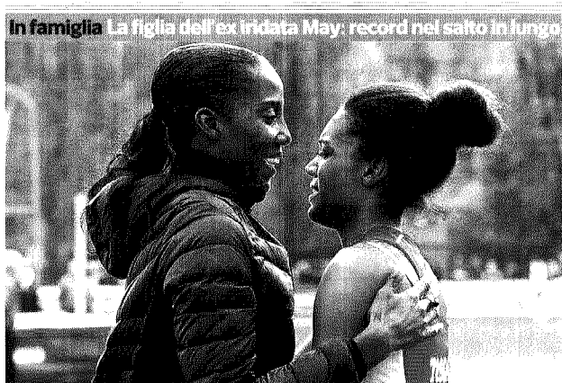
L'abbraccio di Fiona May (48 anni) alla figlia Larissa, che a 15 anni ha saltato in lungo 6,36 metri: più della mamma alla stessa età