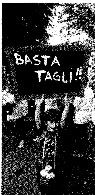
Corteo contro i tagli alla scuola