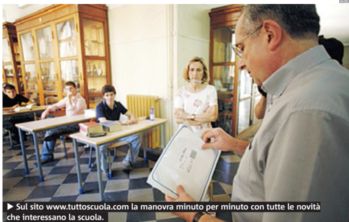
► Sul sito www.tuttoscuola.com la manovra minuto per minuto con tutte le novità che interessano la scuola.

gli scrutini bloccati dallo sciopero dei Cobas. Oggi toccherà a Piemonte, Lombardia, Toscana, Lazio, Campania, Liguria.